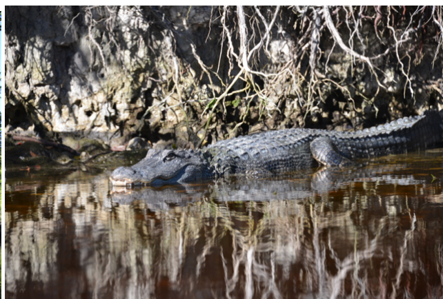
Kroki oder nicht Kroki?

Mit Reservation würde der Platz 10 USD kosten, wir möchten ihm diese bezahlen doch er darf angeblich kein Geld annehmen. „Und wenn ich einfach auf den Platz fahre“ meine Frage? „Dann rufe ich den Sheriff“, knappe Frage, knappe Antwort. Was früher noch problemlos möglich war geht heute gar nicht mehr. Ihr erinnert euch, der Sheriff hat ja kein Pferd mehr, sondern fährt einen tollen Schlitten. Vor einigen Jahren hätte er ja noch an die zwei Tage gebraucht um uns hier wegzujagen, heute geht dies innert Stunden. Fortschritt ist auch nicht immer toll!