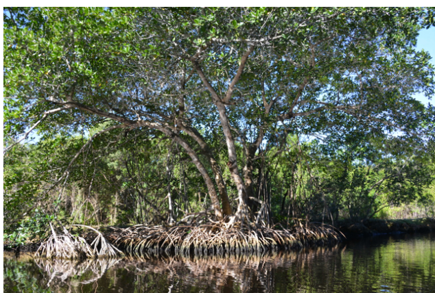
Typische Landschaft in den Everglades

Wir hätten uns per Internet anmelden müssen, ohne Reservation kein Platz, auch wenn der Platz leer ist. Im tiefsten Afrika wäre dies ein Detail, wir würden uns einfach in das nächste freie Netz einwählen und unseren Platz bestellen. Hier in den USA kannst du dies vergessen, wir sind ja meist schon sehr froh, wenn wir in einer Grossstadt ein einigermaßen gut funktionierendes Netz finden.