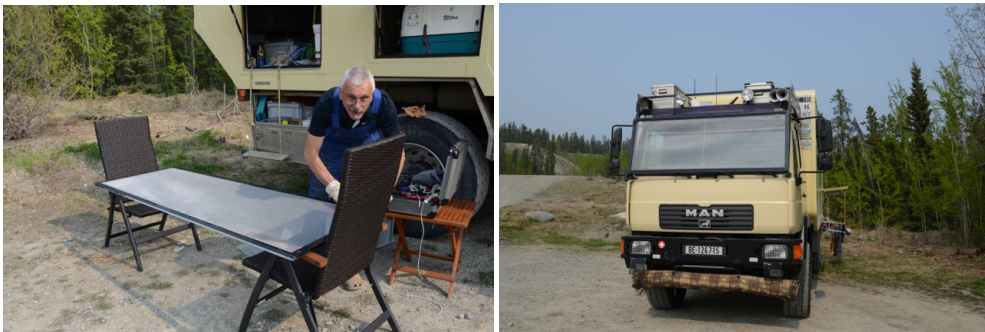
Kaum zu sehen, montiertes Steinschlaggitter

Es gibt ja viele Leute die ihr Leben lang mit einem Brett vor der Birne herumlaufen, ein Fliegengitter vor dem Kopf sollte uns also nicht weiter stören.