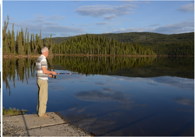
Fischen um 23 Uhr.....und keiner beisst