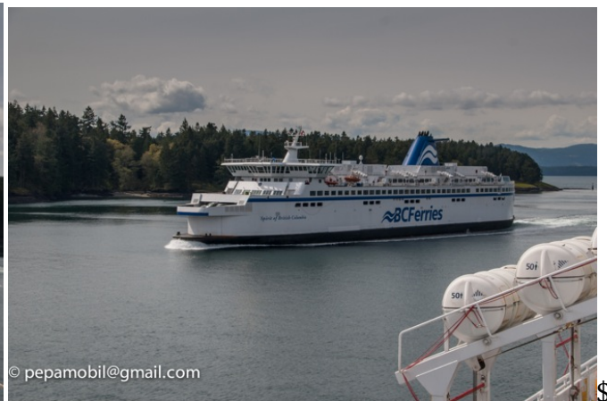
„My Fair Lady „ auf der Fähre nach Vancouver Island

Ha, wir dachten immer Kanada sei sicher! Ist aber halb so schlimm, denn wie wir von der Polizei und den Sicherheitsleuten erfahren passieren die zwei Morde ja eigentlich in Kalifornien. Da es aber sehr viel billiger ist in Kanada zu Morden, respektive zu Drehen, wird die Krimiserie hier auf Vancouver Island gedreht und eben nicht in Kalifornien wo die Serie eben spielt. Wir können nur staunen wie doch schamlos geschummelt wird. Kalifornien und Vancouver Island sind nun ja wirklich nicht gleich Nachbarn und einmal mehr fragen wir uns: „Wo wurde eigentlich die Mondlandung gedreht?“ Definitiv als Banausen stehen wir da, als wir noch fragen ob es bekannte Schauspieler sind die hier mitwirken. „Ihr kennt Miss Blabla und Mister Dingsbums nicht, ja von welchem Planeten kommt ihr denn“?