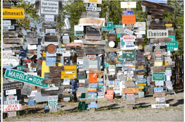
Pepamobil im Schilderwald verewigt