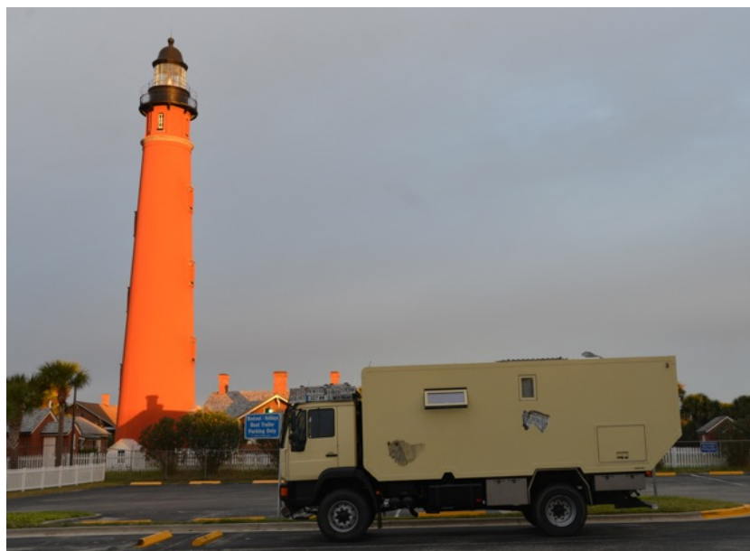
Schlafplatz etwas unterhalb Daytona Beach

Traumhafte Schlafplätze sind im Süden vorhanden. Hier wollte ich mich günstig, quasi gleich ab Fabrik mit Krokodillederschuhes eindecken. Doch auch nach intensiver Suche habe ich kein einziges Exemplar gefunden, das Schuhe angehabt hätte, alle sind sie barfuss, was ja auch Sinn macht bei dem vielen Wasser.