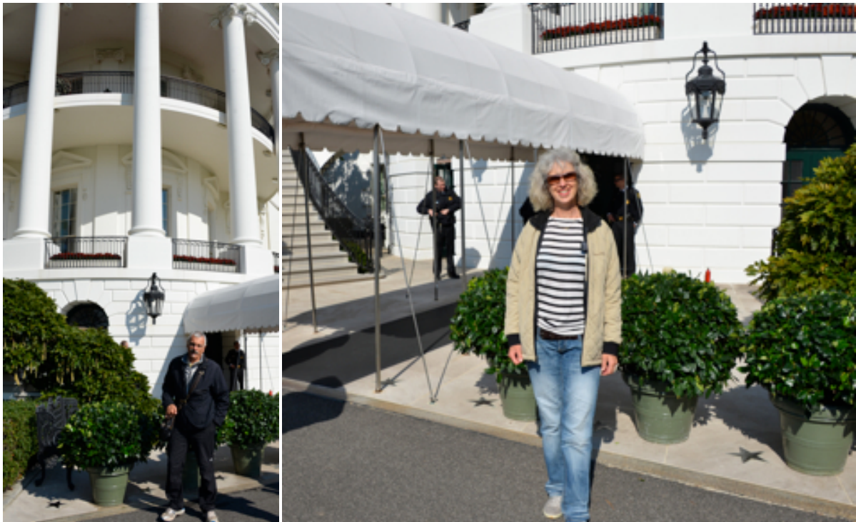
First Lady Pepamobil strahlt wie ein Maienkäfer

Nun zuerst mussten wir an einigen Kontrollen vorbei. Trotzdem es vermutlich die best bewachteste Hütte der Welt ist, war es ganz locker, wesentlich einfacher als ein Museumsbesuch in New York. Danach noch einige Meter ohne weitere Kontrolle und schon standen wir hier.