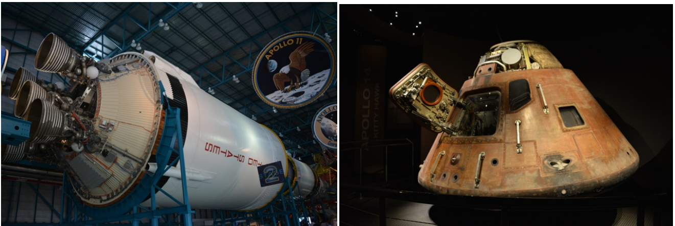
Original Kapsel von einem Apollo Flug

Mal sehen wie lange es geht bis uns die Polizei hier wegschickt.