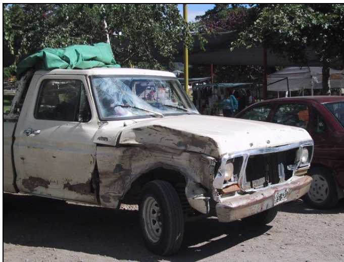
gut erhaltenes Exemplar

Diese Therme liegt in einer Senke und ist nicht ganz einfach zu erreichen. Runter geht es relativ einfach, doch da der technische Stand der Autos der meisten Argentinier auf einem sehr niedrigen Niveau liegt, haben viele grosse Probleme dieses Loch wieder zu verlassen. Ein solches Auto in Burkina Faso oder Nigeria zuzulassen ist undenkbar, in Europa würde alleine der Gedanke, sich ein solches Vehikel als Museumsstück zuzulegen zu einer sofortigen Verhaftung führen.