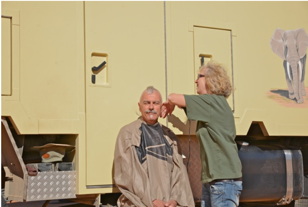
Der Pelz muss weg

Schlusendlich ist die Frage, „wieviel Piste darf es sein“ über die Haarlänge zu beantworten. Je länger der Zopf, umso mehr Piste!