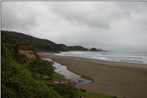
Die Küste von Valdivia/Niebla Chile

Leider haben aber Küstengebiete auch ihre Schattenseiten. Den ganzen Tag sahen wir die Fischfangflotten mit ihren riesengrossen Netzen wie sie die Küste hoch und runter fuhren. Wir hatten das Gefühl, dass sie keinen Meter ausliessen. Am Strand lagen danach die unzähligen abgetrennten Arme und Beine der Krabben, die den Netzen zum Opfer fielen.