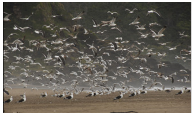
Die vielen toten Krabben zogen natürlich tausende von Möwen an