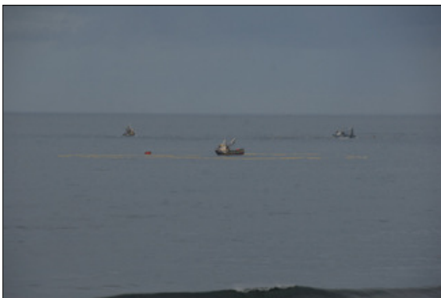
Fischfangflotten waren den ganzen Tag auf See!!! Wir zählten 14 Schiffe!